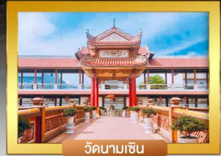
วัดนามเซิน