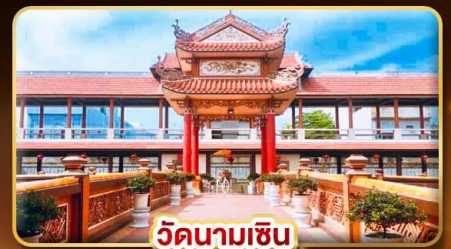
วัดนามเซิน