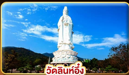
วัดลินห์ฮิ่ง